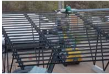
Montaggio degli arcarecci