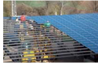
Montaggio dei moduli